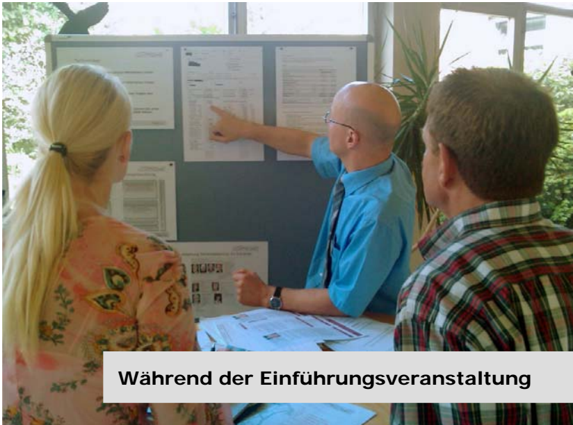
Während der Einführungsveranstaltung

Auf unserer Homepage www.sk-mg.de erhalten Sie einen Überblick über die in den Städtischen Kliniken Mönchengladbach möglichen Facharztweiterbildungen.